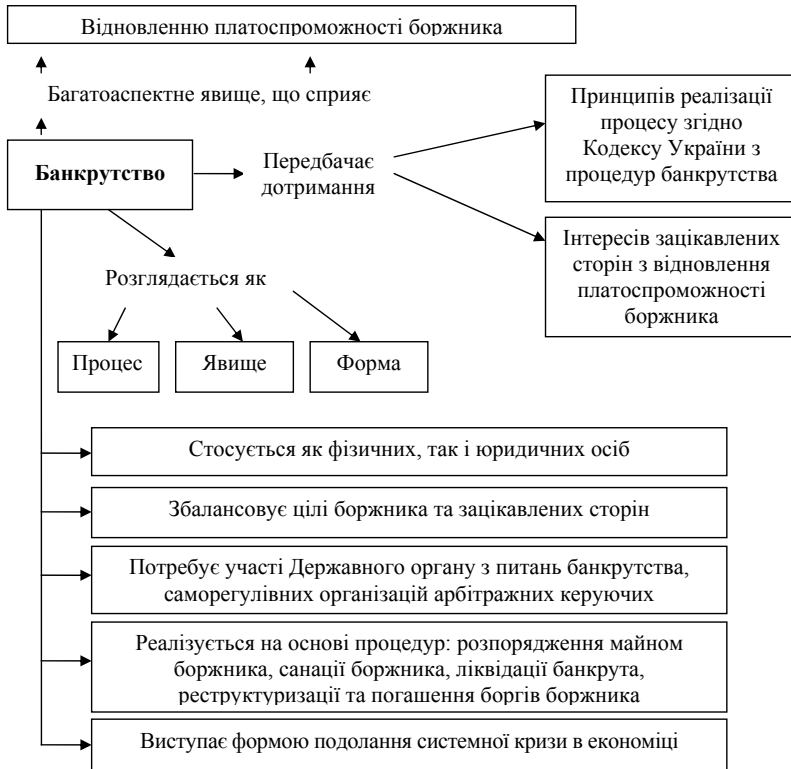
Рис. 1. Узагальнена характеристика банкрутства як наукової категорії, авторська розробка

Узагальнення характеристики банкрутства як багатозначної наукової категорії дозволяє її розглядати і як наслідок, і як причину. Тобто, з однієї сторони, одночасне банкрутство багатьох компаній в країні чи світі, наприклад, як результат непродуманої державної політики, може призвести до виникнення локальних, національних чи глобальних криз. З іншої сторони, значна кількість банкрутств може стати наслідком глибокої системної кризи, яка проявляється чи то в негативних фінансових результатах діяльності суб'єктів господарювання, чи то – в їхній неплатоспроможності [8, с. 165]. Та чи слід розглядати банкрутство лише як загрозу?